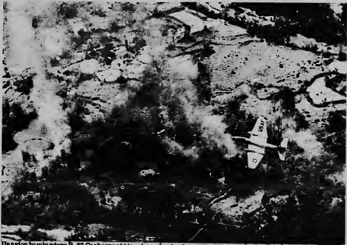
Un avion bombardero B-57 Canberra aki ta sobrevolando riba un aerea caminda e guerrilleronan comunista tin almacennan di abastecimento den e provincia Chau Doc. Ora e avion a laga su bomnan cai, e explosionnan qu el a causa a pone e almacennan explota e bomnan y municion qu tabatin den nan. Na man robes por mira claramente e candela y huma qu e bombardeo a causa.

E mericanonan a arresta binti persona di quendenan ta ser sospecha qu nan ta partidario di Vietcong.